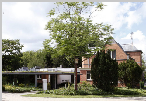
Museum Tot Zover

13 juni 2019 t/m 19 januari 2020 Nederlands Uitvaart Museum Tot Zover, Kruislaan 124, 1097 GA Amsterdam